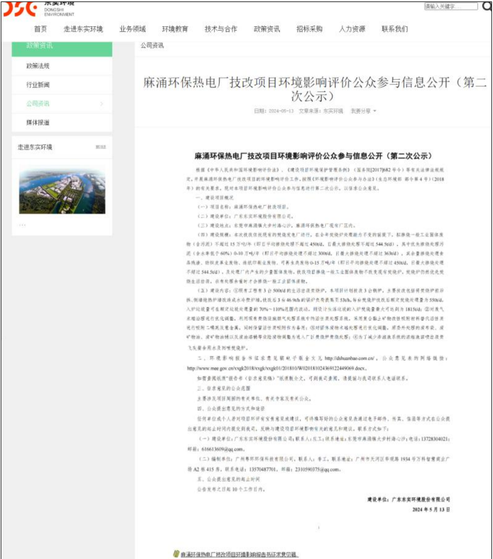
图 3.2-1 征求意见稿网上公示截图