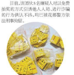
警方缴获的“抽奖券”。

上,收网时机成熟,抓捕警方在花东镇一公寓成功将该团伙5名全部抓获。 目前,该团伙5名嫌疑人对以免费抽奖的方式引诱他人入局、进行诈骗的行为供认不讳,均已被花都警方依法刑事拘留。