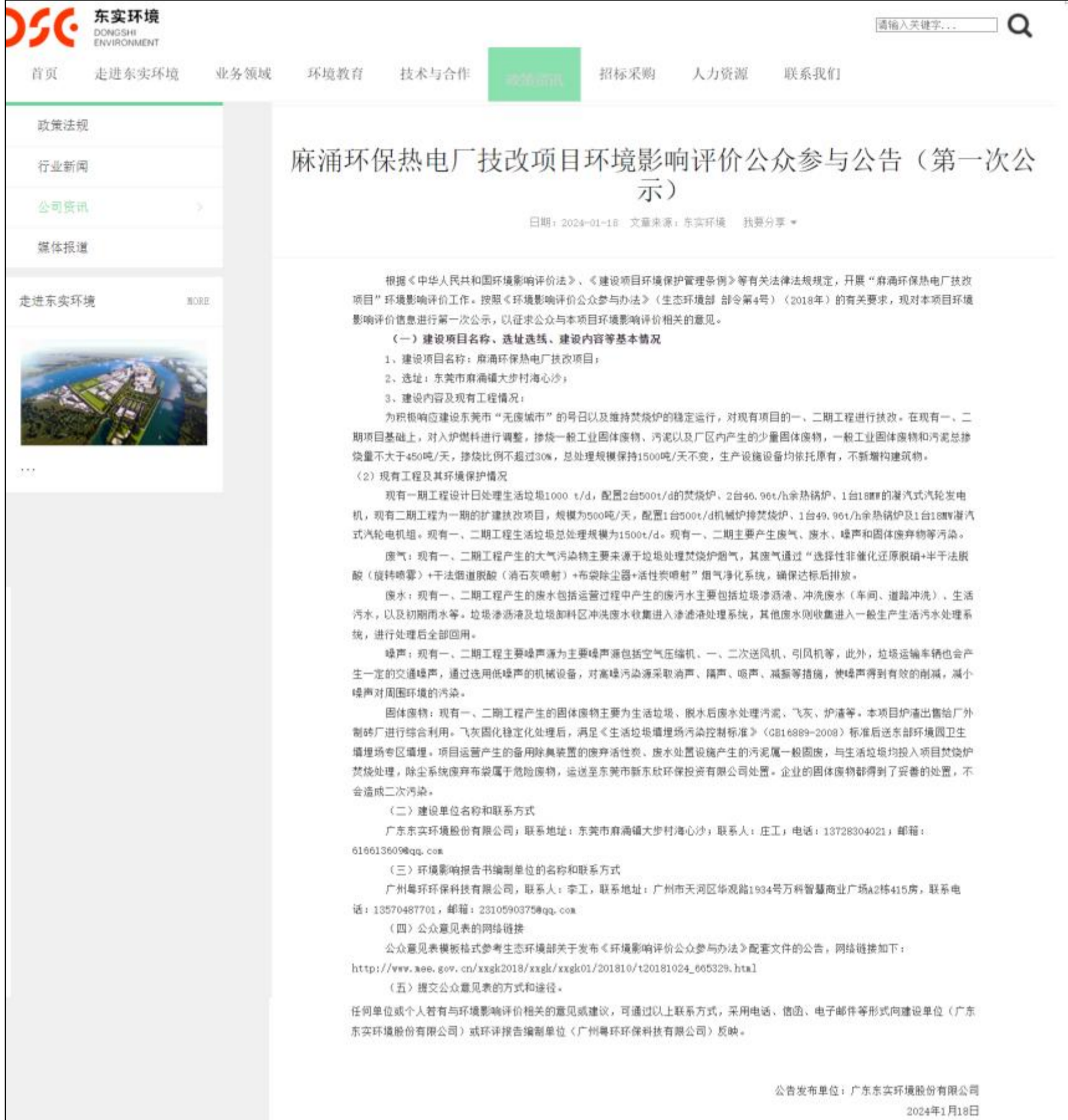
图 2.2-1 本项目首次环境影响评价信息公示截图