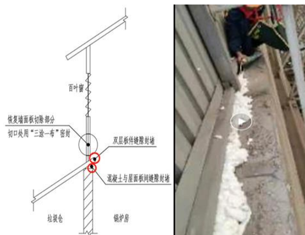
图 5 本项缝隙示意图

隙示意图如下所示，做作业点参考附图 5，工作量及密封涂料宽度要求见工作量汇总表。（本处作业临边，注意高空作业及安全防护。）