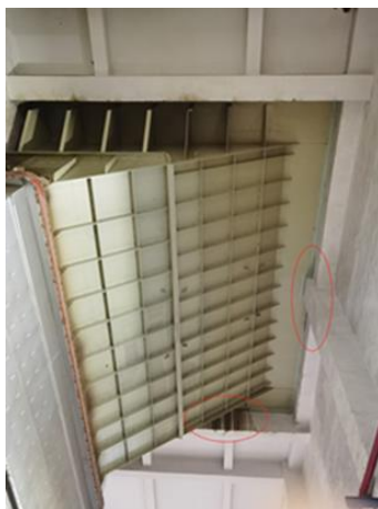
图 4 焚烧炉接料斗周边缝隙示意图

三台焚烧炉接料斗与四周土建间存在缝隙，该缝隙与垃圾池连通，需进行密封处理。作业点离下方平台高约 12 米，参考附图 4，现场图如下所示，工作量及密封涂料宽度要求见工作量汇总表。（本处作业靠近焚烧炉，请注意高温作业。）