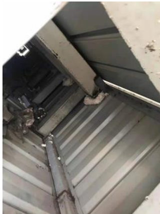
图 2 垃圾池檐口内方钢管

垃圾池屋面、檐口离地面高度约 50 米，已做密封处理，作业面主要是垃圾池檐口内 95 根方钢管管口（150*150）密封，作业点参考附图 1，现场图如下所示。